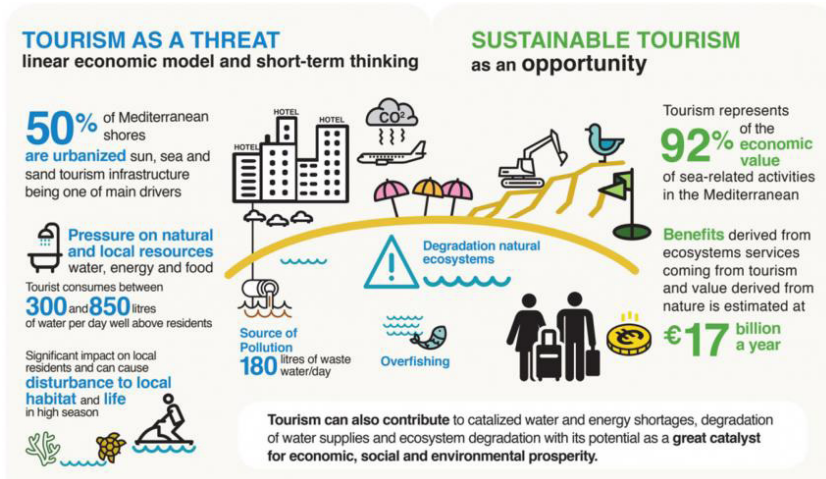
Gambar 3. Pariwisata sebagai Ancaman dan Pariwisata Berkelanjutan

Dengan menerapkan prinsip-prinsip ini, pembangunan berkelanjutan menciptakan keseimbangan antara kebutuhan manusia dan perlindungan lingkungan sehingga menciptakan kondisi yang berkelanjutan bagi kesejahteraan manusia dan kelangsungan hidup planet ini dalam jangka panjang.