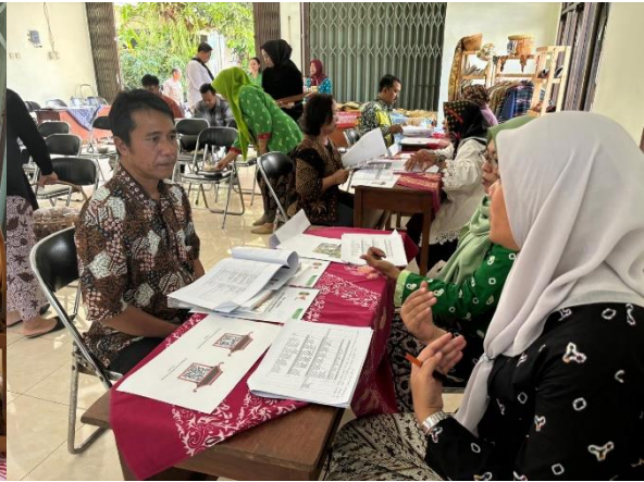
Kelurahan Terban, Gondokusuman, Yogyakarta