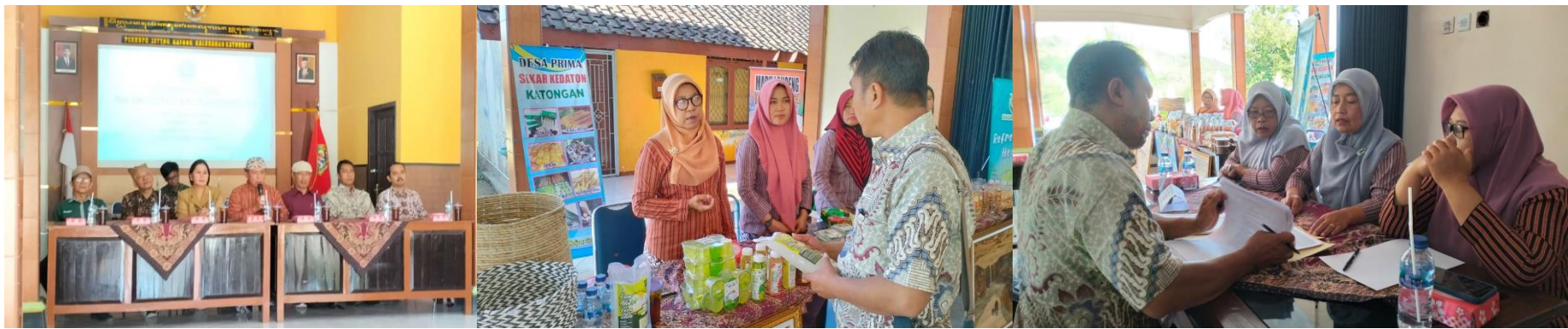
Kalurahan Katongan, Nglipar, Gunungkidul