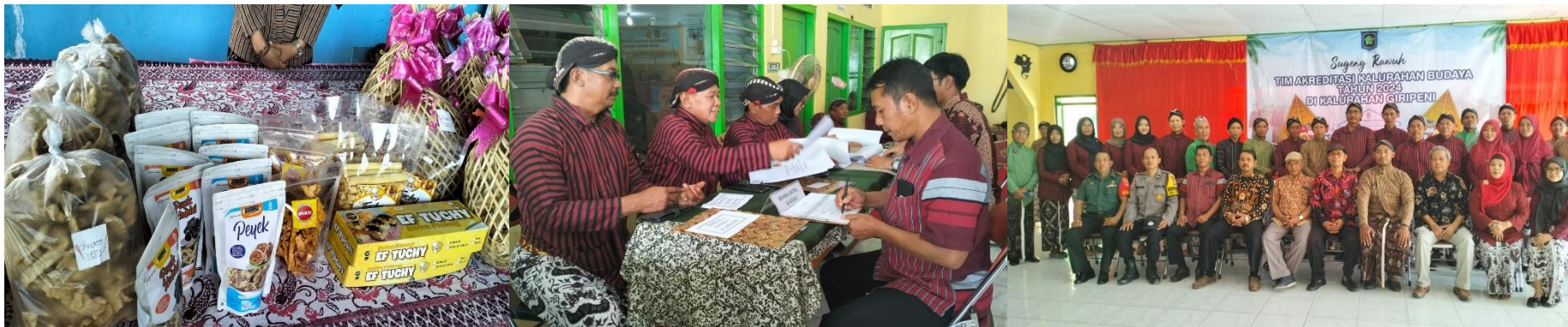
Kalurahan Giripeni, Wates, Kulon Progo