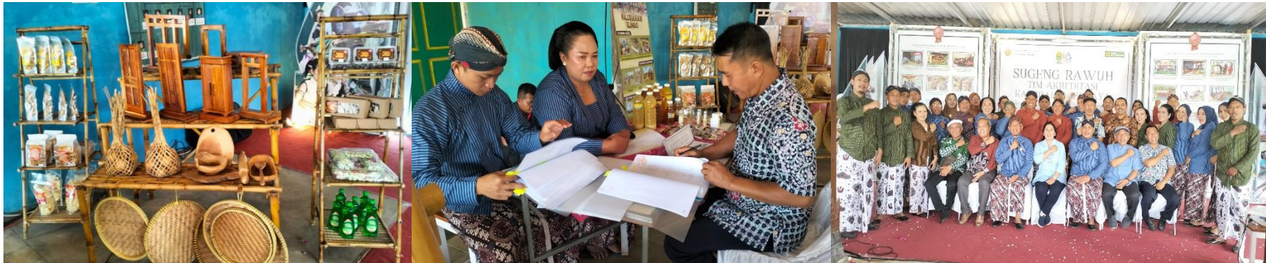
Kalurahan Dlingo, Dlingo, Bantul