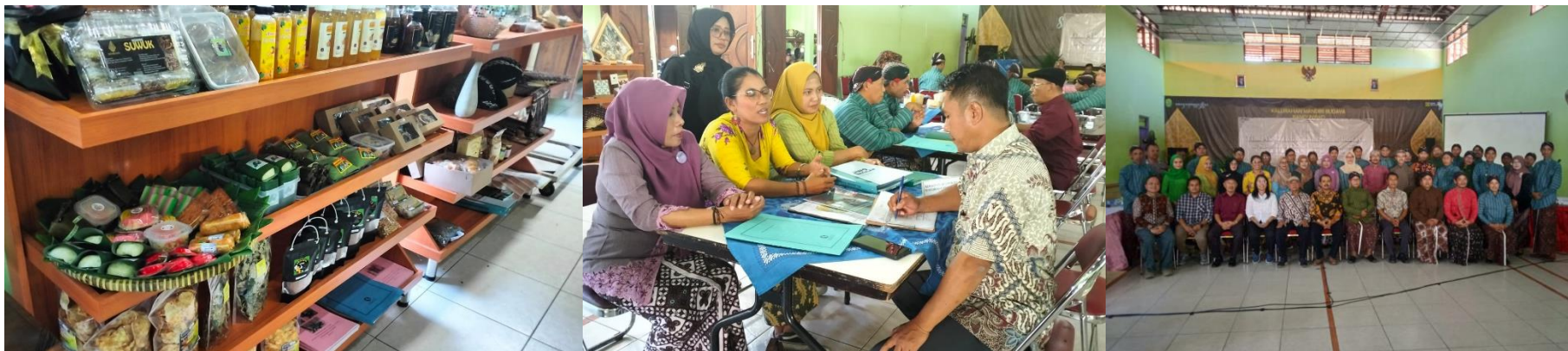
Kalurahan Bangunjiwo, Kasihan, Bantul