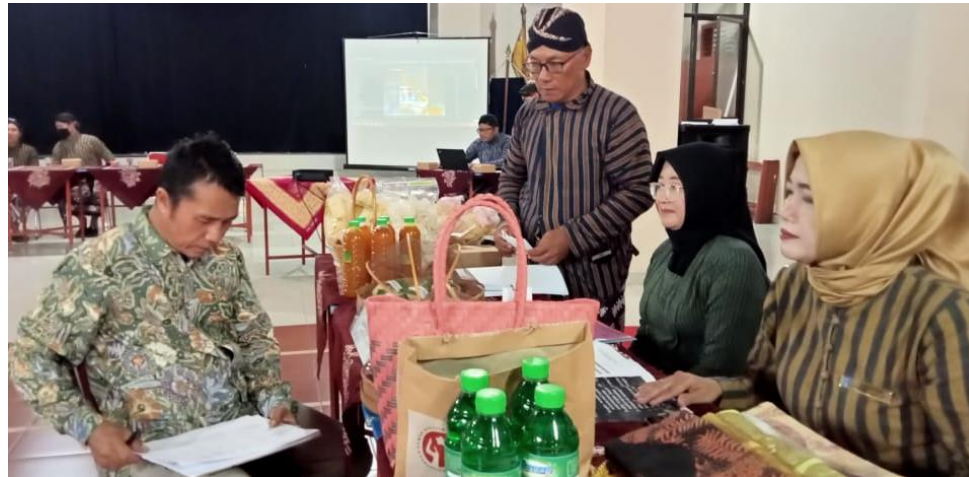
Kalurahan Sinduadi, Mlati, Sleman