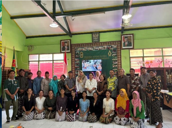
Kelurahan Ngricak, Tegalrejo, Yogyakarta