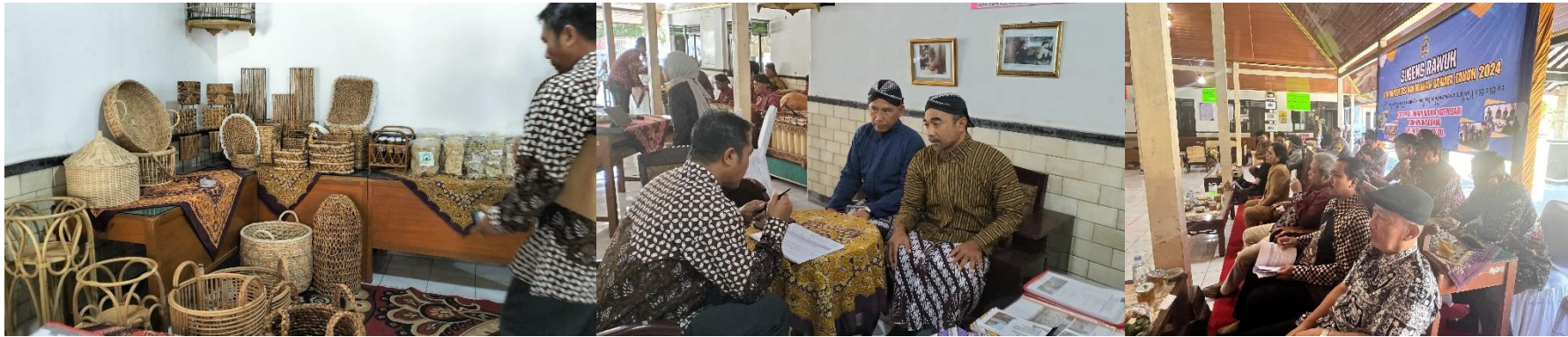
Kalurahan Ngeposari, Semanu, Gunungkidul