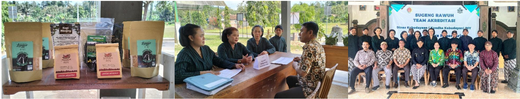
Kalurahan Pagerharjo, Samigaluh, Kulon Progo