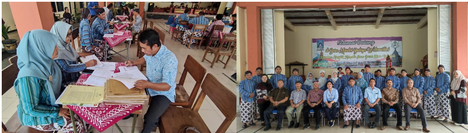
Kalurahan Wedomartani, Ngemplak, Sleman