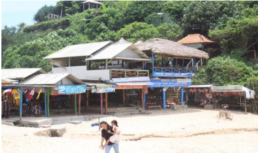
Gambar 1. Warung Makan Sebagai Salah Satu Pelaku Usaha Pariwisata