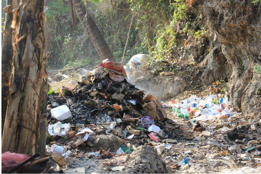
Gambar 3. Kondisi TPA di Pantai Pulang Sawal