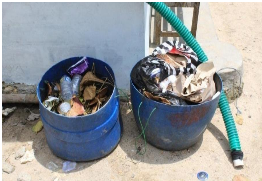
Gambar 2. Timbulan Sampah yang Dihasilkan Pelaku Usaha Pariwisata