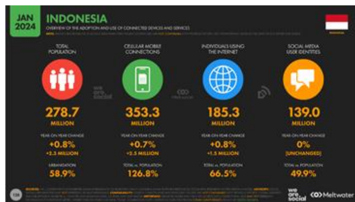
Gambar 1.1 Data pengguna media sosial di Indonesia 2024, 2025

Berwisata saat ini tidak semata-mata hanya mengunjungi suatu tempat wisata dan melakukan aktivitas di tempat, tetapi juga mengabadikan tempat wisata tersebut guna memenuhi kebutuhan media sosial. Pengguna media sosial saat ini beragam, mulai dari usia muda hingga dewasa. Hampir semua kalangan saat ini menggunakan media sosial di kehidupan sehari-hari.