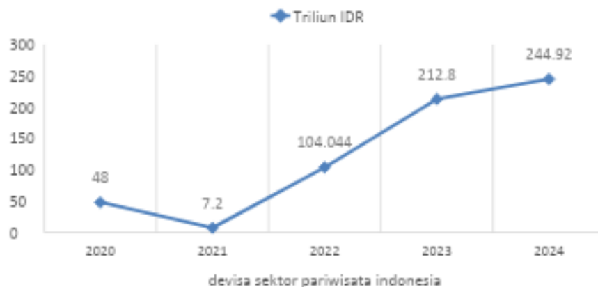
Gambar 1 Penerimaan Devisa Sektor Pariwisata Indonesia 2020-2024