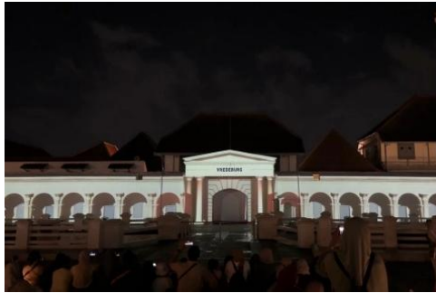
Gambar 1. 2: Video Wall Mapping