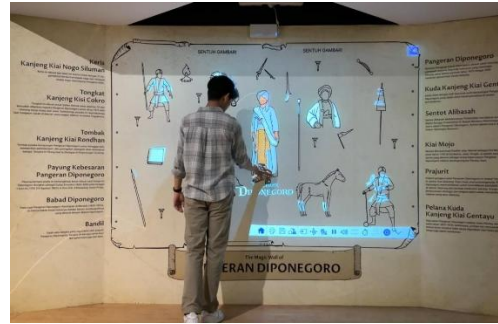
Gambar 1. 3: The Magic Wall Pangeran Diponegoro