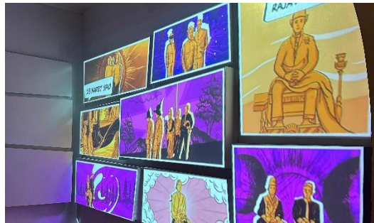
Gambar 1. 4: Komik Digital

Beralih ke revitalisasi yang dilakukan oleh Indonesian Heritage Agency (IHA) pada tahun 2024, Museum Benteng Vredenburg dilakukan revitalisasi namun tanpa mengubah keaslian dari segi bangunannya. Sehingga hanya memperkuat struktur bangunan dan memperbaiki kerusakan. Yang menjadikan revitalisasi tahun 2024 berbeda dengan tahun-tahun berikutnya yaitu dari segi pembangunan pariwisatanya yang lebih modern dengan meningkatkan teknologi terkini sehingga dapat menyesuaikan kebutuhan masyarakat masa kini. Terdapat beberapa karya tambahan yang dipadukan dengan kecanggihan teknologi yang interaktif seperti The Magic Wall of Pangeran Diponegoro , komik digital yang bercerita mengenai peristiwa Agresi